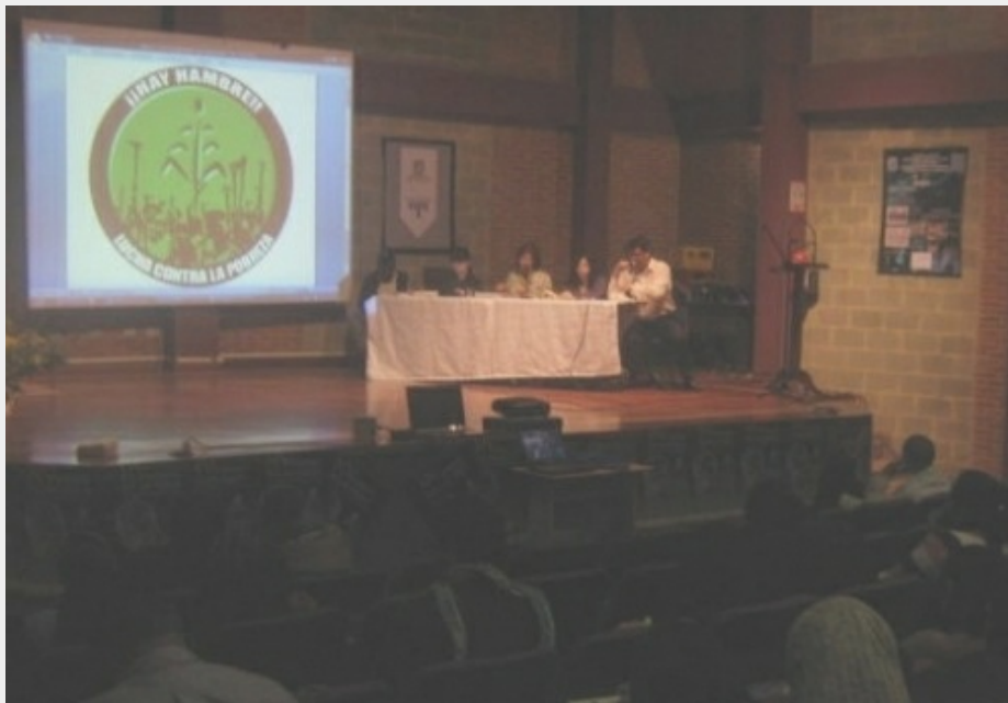
Desarrollo del Foro en la sede de la U. Distrital en "Ciudad Bolívar" - sur de Bogotá.

Por auténtica iniciativa popular y con el auspicio de la Universidad distrital durante el día viernes 13 de Noviembre los asistentes al Foro intercambiaron experiencias de lucha contra el hambre tanto en lo rural como en las ciudades. Fue enfático el rechazo a las políticas actuales del Gobierno como "Agro ingreso seguro, acción social, Red Juntos, comedores comunitarios y otros, que sólo han aumentado la exclusión y derivado en más dolor familiar, sobre todo para los más